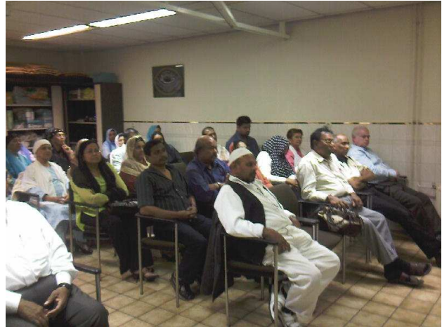
Een impressiefoto van de dag