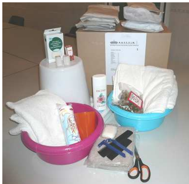
Een compleet en uitgebreid pakket voor de ghoesoel.

Alle benodigdheden voor de ghoesoel zijn verpakt in een kartonnen doos en de katoenenstof is ingepakt om verkleuring te voorkomen. Bovendien is de stof voorgeknijpt, waardoor je het meteen kan gebruiken. Verder zijn de olijfbladeren (beirum) in de originele verpakking gelaten. Deze moeten uiteraard eerst gekookt worden in water.